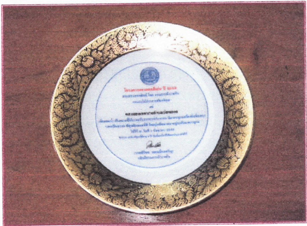
ตลาดสดเทศบาลตำบลบ้านดง