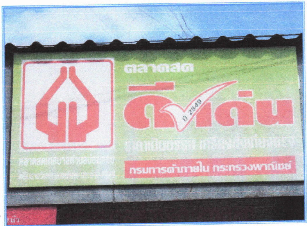
ตลาดสด ดีเด่น ประจำปี 2549